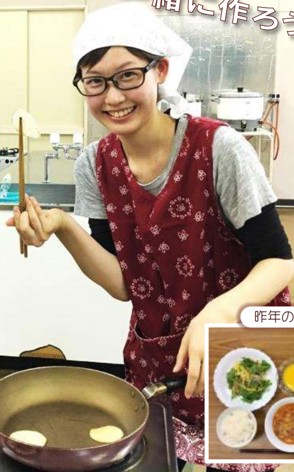
昨年のメニュー例